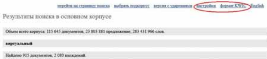
Рис. 2. Выбор режима просмотра и сортировки найденных примеров | Fig. 2. Selection of the output format and sorting settings for the examples

тексте KWIC-выдачи (по умолчанию длина контекста — 5 слов), 4) количество примеров на странице (по умолчанию установлено 50 примеров).