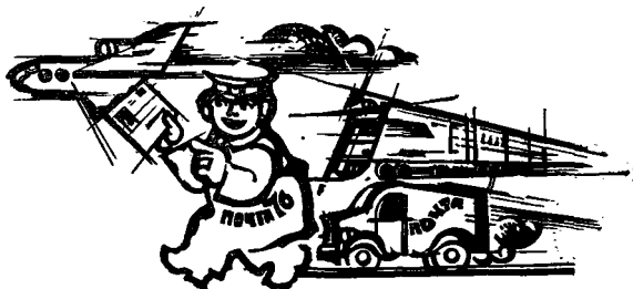
ПОЧТА «РУССКОЙ РЕЧИ»