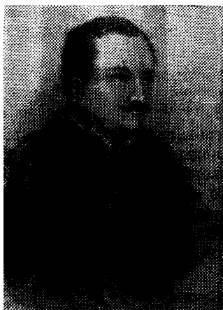
А. И. Одоевский

Небезынтересна и такая деталь: гости в балладе «Зосима» садятся за стол, « накрытый браной скатертью » (праздничной стол), а новгородские изгнанники располагаются «вдоль стола белодубового », непокрытого, неубранного. «Браная — это сделанная из редкой ткани — бранины, или брани — скатерть» («Словарь» 1847 года, т. 1). В «Толковом словаре» В. И. Даля отмечается, что «браная» — это узорочная ткань, которая точется не просто через нитку, а где основа перебирается по узору; браным называется крестьянское цветное (красное) шитье, вышивка по холсту, где нитки берутся счетом.