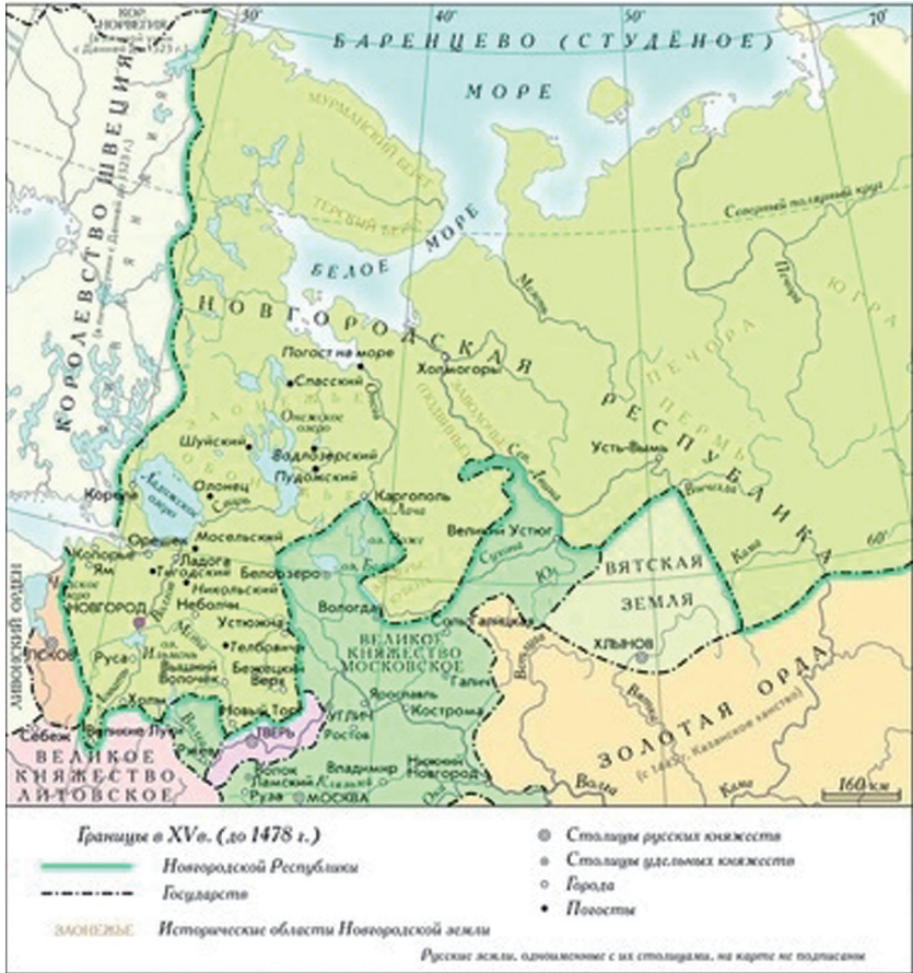
Рис. 3. Карта Новгородской Республики в XV в. (до 1478 г.)