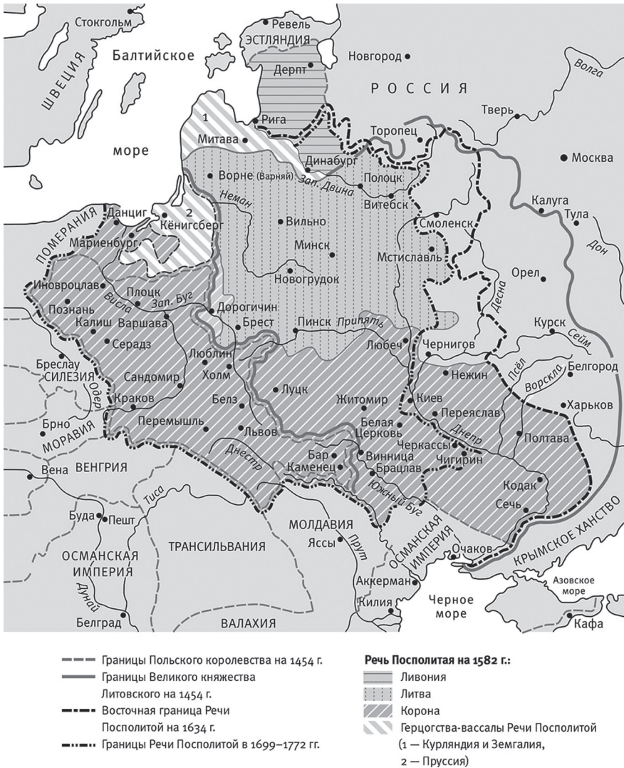
Рис. 2. Карта Речи Посполитой в XVI–XVIII вв. | Fig. 2. Map of the Polish-Lithuanian Commonwealth in the 16 th –18 th centuries

Онежского Крестного монастыря). Такого рода образования имеются и в говорах. Так, в [Филин (гл. ред.) 1978: 249] находим коневал (Онеж., Гильфердинг; Медвежьегор. КАССР, Арх., Ленингр., Новг.), коневалушко (Онеж., Гильфердинг). Вариант с -е- присутствует в [Паникаровская