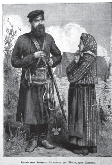
Русские типы. Коноваль. По фотограф. рис. Шпак, грав. Дзедзиц.

У А. Брюкнера слово konował употреблено в словарной статье koń , где просто перечисляются слова, восходящие к данному слову. В статье Р. Брандта «Дополнительные замечания к разбору этимологического словаря Миклошича» приводится информация из словаря Ф. Миклошича [Miklosich 1886: 128] о том, что тому неясна часть wai в konowai , и высказывается предположение, что «д. б. это первоначально шуточное слово: кто валит коней на землю, чтобы выхолостить» [Брандт 1889: 139]. Как видим,